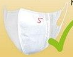
NANOFIBER MASK RESPIMASK