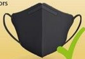
NANOFIBER MASK RESIPRO CARBON